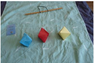
Le mobile des octaèdres à 2 mois.

Le plus complexe dans le montage de ce mobile est l'équilibrage des différents niveaux. Si cela s'avère trop complexe, ne pas hésiter à le modifier.