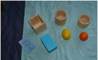
(le set de Nature et Découvertes)

Un œuf en bois sur un coquetier, une sphère dans un bol en bois, etc.