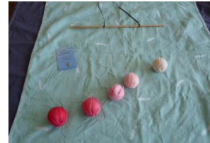
Le mobile de Gobbi à 2-3 mois.

Le mobile est composé de 3 octaèdres, des trois couleurs primaires. Il est possible de le fabriquer en carton fin.