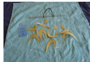
Le mobile des danseurs à 3-4 mois.

Le mobile est composé de cinq sphères (en coton ou en polystyrène) entourées de fil de couleur en dégradé (type DMC pour la broderie). Il suffit de choisir une couleur (rose, rouge, bleu, orange, vert etc) et de trouver cinq dégradés. (Il m'a fallu deux écheveaux par couleur que j'ai trouvé chez Action).